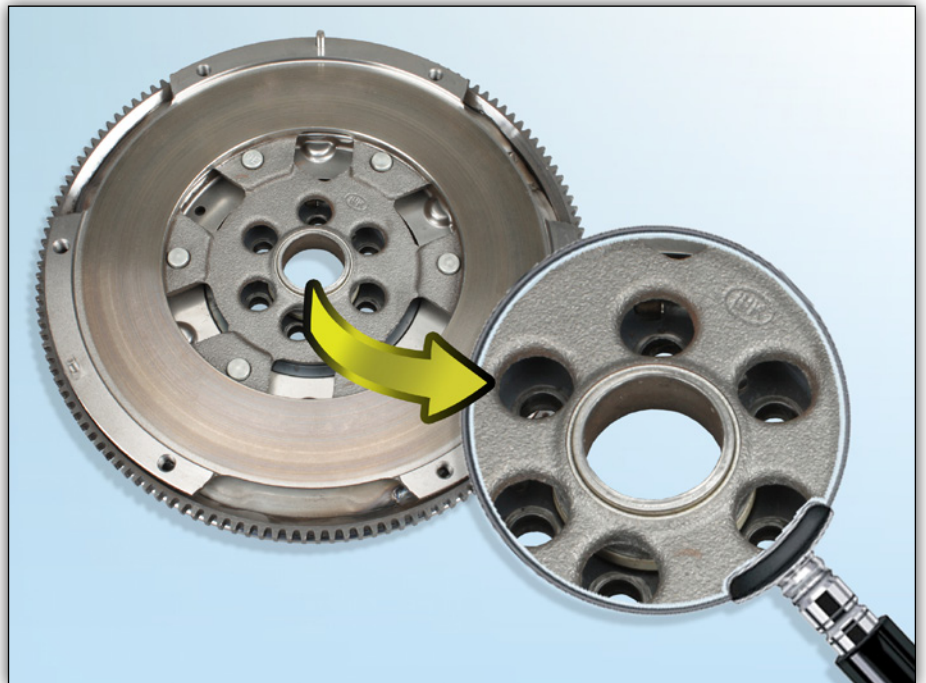
Bild 1: LuK ZMS 415 0059 10 mit Gleitlager

Die oben aufgeführten Fahrzeuge können mit einem LuK- oder Sachs-Zweimassenschwungrad (ZMS) ausgestattet sein. Beide ZMS unterscheiden sich konstruktiv voneinander und können nicht ohne weiteres miteinander verglichen werden.