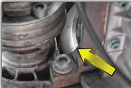
Bild 3: Nach Demontage des Abdeckblechs sind die Unterscheidungsmerkmale sichtbar.

Die Bilder 4-7 zeigen die Unterscheidungsmerkmale der beiden Zweimassenschwungräder. Diese sind in eingebautem Zustand durch ein Sichtfenster in der Getriebeglocke erkennbar (siehe Bild 3).